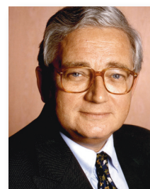
Patrice Ract Madoux Président de la CADES

En 2010, les recettes de CRDS et de CSG ont atteint 8,1 milliards d'euros et ont permis d'amortir la dette à hauteur de 5,1 milliards d'euros, conformément à l'objectif d'amortissement pour l'année 2010 fixé par la loi de financement de la sécurité sociale, après avoir versé 3,0 milliards d'euros d'intérêts aux porteurs des obligations émises par la CADES.